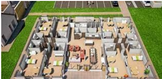
Plan standard de l'une des unités pour huit résidents

Lors du conseil municipal du mois de mai, il a été voté un budget annexe pour y faire figurer toutes les opérations concernant le projet d'implanter sur la commune une résidence senior en partenariat avec "Ages et vies" dont le siège social est basé en Franche Comté mais qui se développe dans notre région comme à Neuville de Poitou ou à Naintré. Alternative à la maison de retraite pour des personnes qui jouissent encore d'autonomie, le projet concerne la réalisation d'une résidence pour seize personnes ou couples bénéficiant d'un espace privatif avec accès à l'extérieur et d'une pièce de vie commune. Une présence permanente de personnel qui réside sur place apporte tous les services attendus. A l'heure actuelle, en accord avec les propriétaires, la municipalité a décidé d'acquérir une parcelle rue des Nauds. Le permis d'aménager est en cours d'instruction avec sept lots pour maisons individuelles qui seront mis à la vente en 2022. Nous ne manquerons pas de vous tenir informés de l'avancement de ce projet qui devrait être opérationnel au cours de l'année 2023.