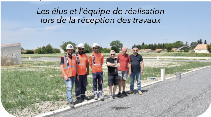
Les élus et l'équipe de réalisation lors de la réception des travaux

Le 8 juin a eu lieu la réception définitive des travaux de ce lotissement de huit parcelles . La grande permettra la construction de la future maison pour séniors par "Ages et Vie", les sept autres sont destinées à la construction de maisons individuelles . Quatre sont déjà réservées. Les personnes intéressées par les dernières peuvent s'adresser à la mairie.